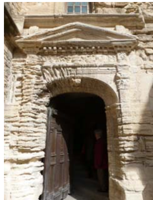
Porte du Château