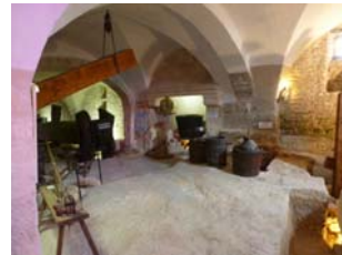
Intérieur du moulin