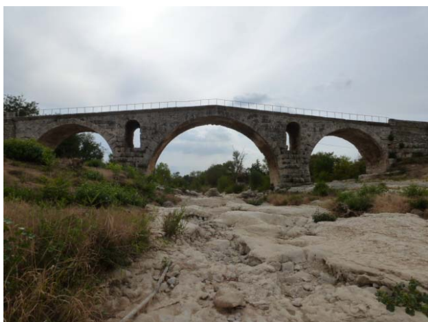
Le Pont Julien construit en 3 avant J.C.

Il a été intégré au réseau routier jusqu'en 2005, ce qui prouve la qualité des constructions romaines.