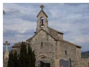
Chapelle Saint Pantaléon

Les vitraux modernes ont été réalisés par Madame Frédérique Duran.