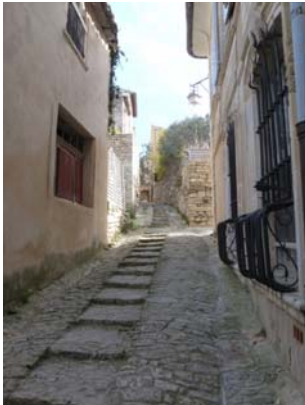
Rue caladée en escalier

De retour sur la place Genty Pantaly, propriétaire du restaurant Le Renaissance qui a accueilli de nombreuses personnalités, nous passons devant la fontaine, seul point d'eau du village jusqu'en 1956. Après avoir franchi la magnifique porte du château, nous gravissons un très bel escalier pour atteindre la salle de réception où nous pouvons admirer la splendide cheminée renaissance de plus de 7 mètres de large, finement sculptée et, pour finir, l'ancienne cuisine devenue l'Office du Tourisme.