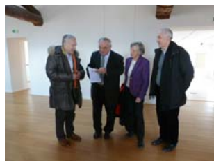
Echange de cadeaux