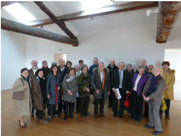
Le groupe de l'ARPA reçu par Monsieur le Maire