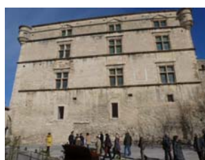
Façade sud du Château

Après la dernière guerre, Victor Vasarely y a entrepris de grands travaux de restauration et un musée inauguré en 1970 par Madame Pompidou, présente une partie de ses œuvres jusqu'en 1996.