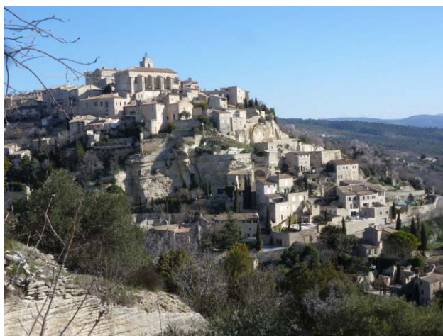
Vue de Gordes perché sur son rocher

L'arrivée sous le soleil, nous permet d'avoir une belle vue d'ensemble de ce beau village perché sur son rocher dominé par les masses imposantes de son château et de son église.