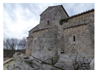
Abside et tombes rupestres

A l'intérieur de la chapelle on peut aussi admirer un Christ contemporain fabriqué à partir d'outils agricoles.