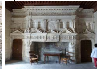
Cheminée du Château