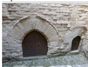
Aumônerie Saint Jacques